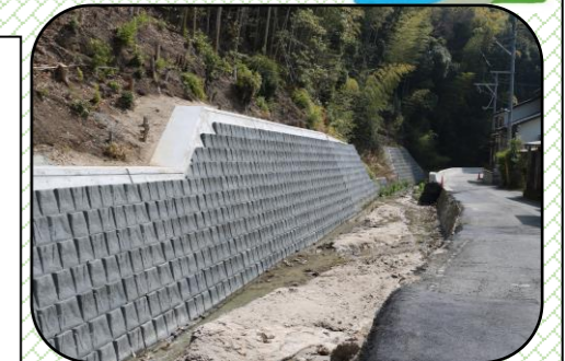
『はるなウィメンズクリニック』病院裏の平田川 山側の護岸が整備されている

自治会連合会では毎年、山口県に平田川の豪雨災害に対応できる拡幅、浚渫工事を要望しています。拡幅工事は平田川最深部での工事、3年後には完成できると思います。また浚渫工事は数年かかる予定です。最近の工事を紹介します。