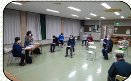
3月23日、社協常任理事会で検討

4月22日の社会福祉協議会前期総会で『自治会連合会・社協スリム化』は承認されました。