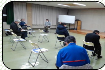
3月3日、社協常任理事会で検討

平田地区に押し寄せる新しい動きに対して、従来の組織をより活動しやすくするために、数度の検討会を開催しました。