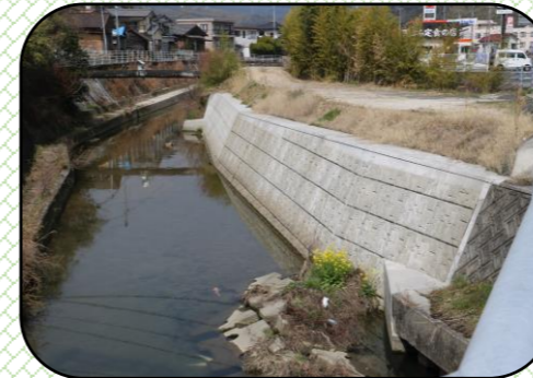
ENEOSガソリンスタンド裏川底の浚渫、護岸整備完成

自治会連合会では毎年、山口県に平田川の豪雨災害に対応できる拡幅、浚渫工事を要望しています。拡幅工事は平田川最深部での工事、3年後には完成できると思います。また浚渫工事は数年かかる予定です。最近の工事を紹介します。